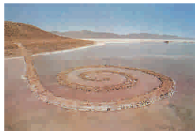
Robert Simpson, Spiral Jetty (molo a spirale); Salt Lake City, Utah, USA, 1970

Ben Harper “Live from mars” Etichetta: Sony 2001